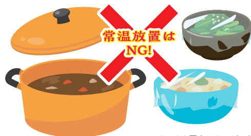
※イラストや写真はイメージです。